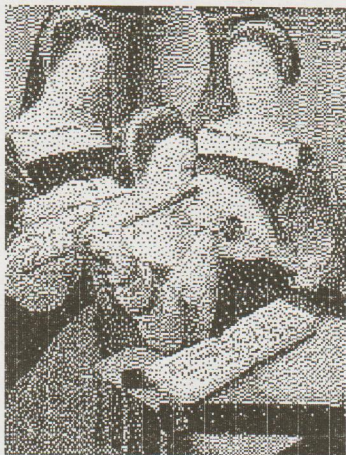
meister der weiblichen halbfiguren. drei musizierende mädchen. - 1830.